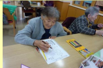
意外と難しいね～何色で染めようかな？