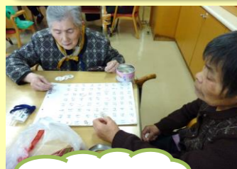
塗り絵・数合わせ